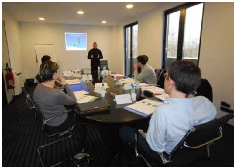
Les stagiaires de « Levito » lors d'un accompagnement coaching.

Leurs clients, des cadres et chefs d'entreprises de TPE, PME, mais aussi de grands groupes, ne sont pas forcément de la Région Parisienne. « Add Val You » a un tissu local et national tandis que « Levito » oeuvre aussi à l'étranger. Dernièrement, celle-ci a mené une formation à Shangai et travaille pour des groupes internationaux comme